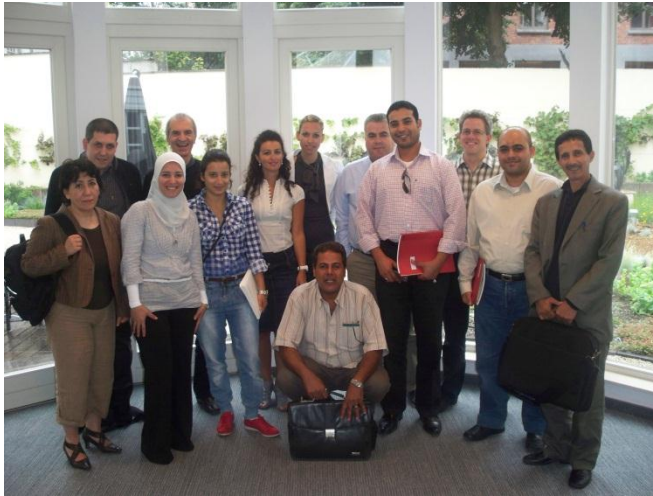
Photo de groupe : formation sur la gestion des DEEE pour les agents d'Algérie, Albanie, Liban et Palestine.

Personne à contacter au sein du secrétariat de l'ACR+ : Jean-Jacques Dohogne ( jjd@acrplus.org )